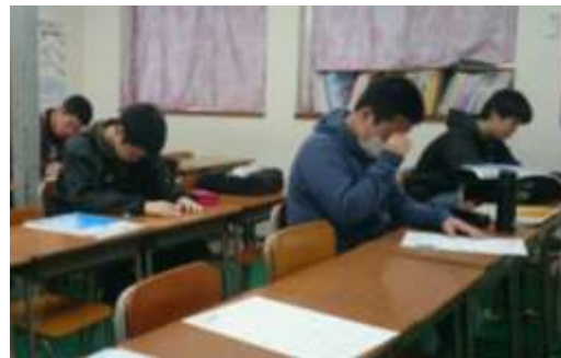
パーフェクトゼミ風景

2学期より、中学3年生を対象に入試必勝パーフェクトゼミを行います。入試に向けて、基礎問題の反復練習から応用問題への挑戦まで、数多くの問題に取り組む特別授業です。後半ではテスト形式の実践問題に徹底して取り組み、入試に対する不安を失くし自信を持たせます。「これだけのことをやったんだ。」という気持ちで、合格を勝ち取る大きな自信になります。