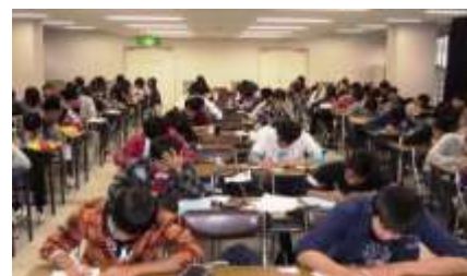
(国立吉備青少年自然の家にて)

中学受験をする小学 6 年生と中学 3 年生を対象に、1 1 月初旬に 1 泊 2 日の勉強合宿を行います。泊まり込みで勉強漬けの 2 日間を過ごし、真の学習とは何かを体得し、秋以降の飛躍の足掛かりを得るのに大変役立っています。